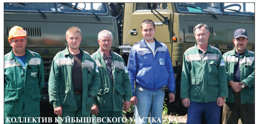
КОЛЛЕКТИВ КУЙБЫШЕВСКОГО УЧАСТКА

Свой коллектив начальник участка охарактеризовал весьма лаконично: «Народ добросовестный, люди точно выполняют поставленные задачи, своевременно и качественно».