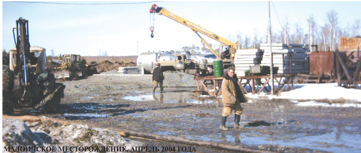
МАЛОИЧСКОЕ МЕСТОРОЖДЕНИЕ, АПРЕЛЬ 2004 ГОДА

Через год УТТ было переведено в ЗАО «РЦСУ-Нягань» в качестве сервисного предприятия, которое оказывало транспортные услуги «Блоку добычи». В декабре 2005 года в результате внедрения в дочерние общества «ТНК-ВР» инновационных процессов ОАО «ННГ» начало выводить из-под своего «крыла» сервисные