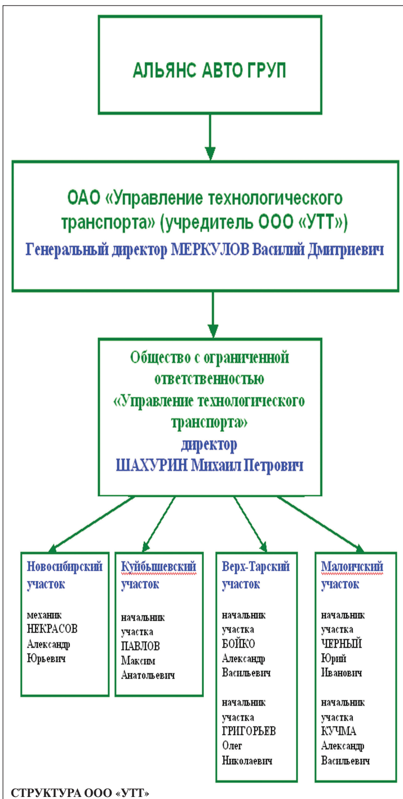
СТРУКТУРА ООО «УТТ»