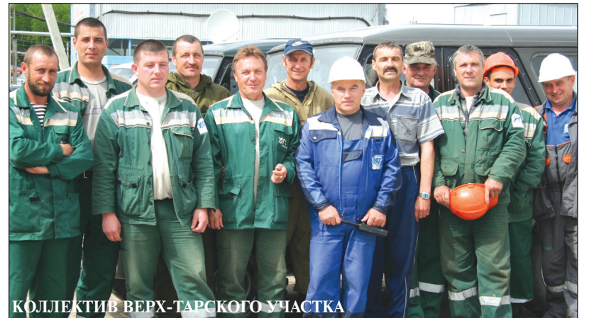
КОЛЛЕКТИВ ВЕРХ-ТАРСКОГО УЧАСТКА