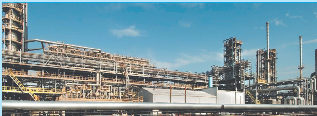
Рязанский нефтеперерабатывающий завод

Кроме того, считаю, что необходимо работать с кадрами, надо пытаться налаживать работу здесь, исходя из определенных хозяйственных принципов, а не только административных.