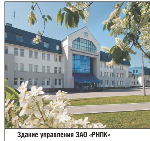
Здание управления ЗАО «РНПК»

специалисты, способные обеспечить своевременность и качество при оказании транспортных услуг, ремонте и прочем. Весь коллектив нашего подразделения нацелен на безопасную и эффективную работу, на то, чтобы оправдать доверие нашего заказчика», - заключает руководитель проекта Виталий ФИЛАТОВ.