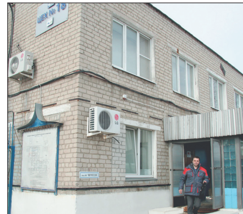
АБК рязанского подразделения ОАО «УТТ»