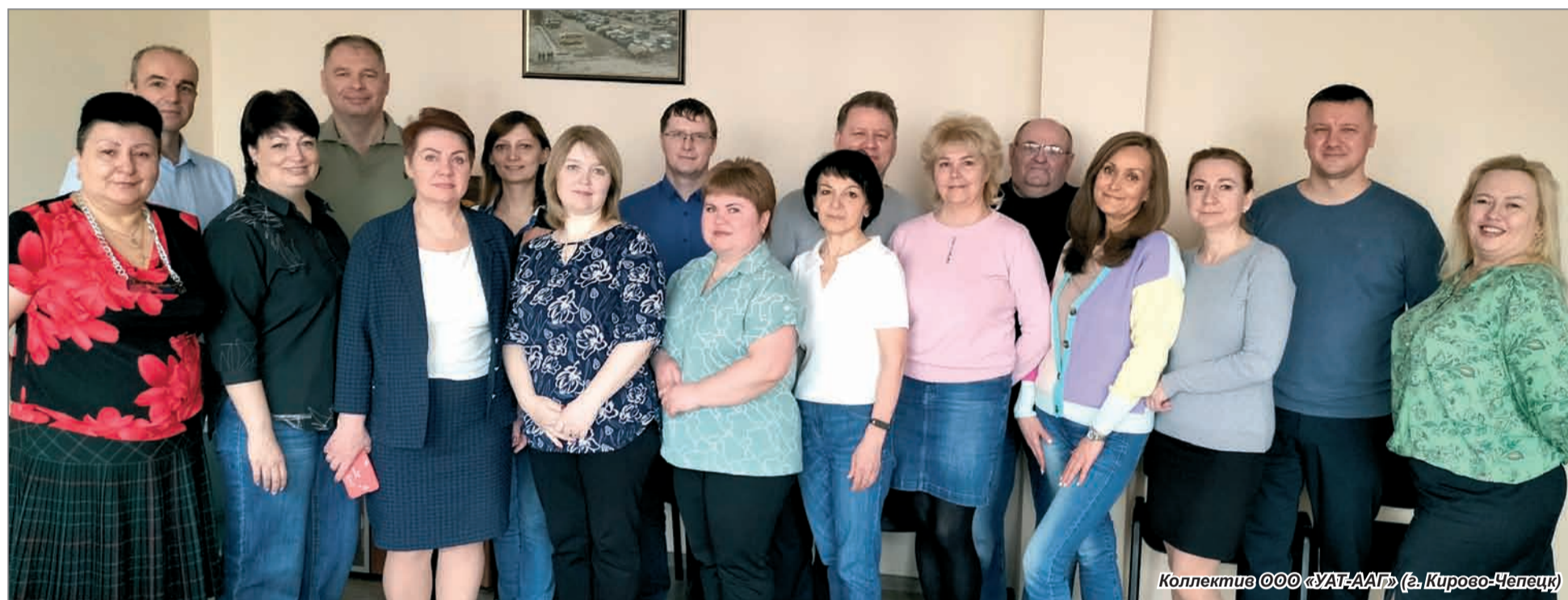
Коллектив ООО «УАТ-ААГ» (г. Кирово-Чепецк)