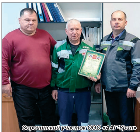
Сорочинский участок ООО «ААГ-Урал»

В ООО «АльянсАвтоГрупп-Урал» в преддверии профессионального праздника на каждом участке прошли торжественные собрания.