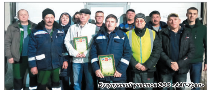
Бузулукский участок ООО «ААГ-Урал»

профессиональным праздником, никого особо не выделяя: в нашем предприятии каждый сотрудник – передовик производства, говорю это со всей ответственностью. Каждый достоин почетной грамоты предприятия и слов особой благодарности за отличную, добросовестную слаженную, порой, самоотверженную работу. И потому каждый наш работник был премирован в преддверии Дня автомобилиста, а особо отличившиеся сотрудники участков – еще и были представлены к Почетной грамоте ООО «АльянсАвтоГрупп-Урал» за добросовестный труд и высокие производственные показатели».