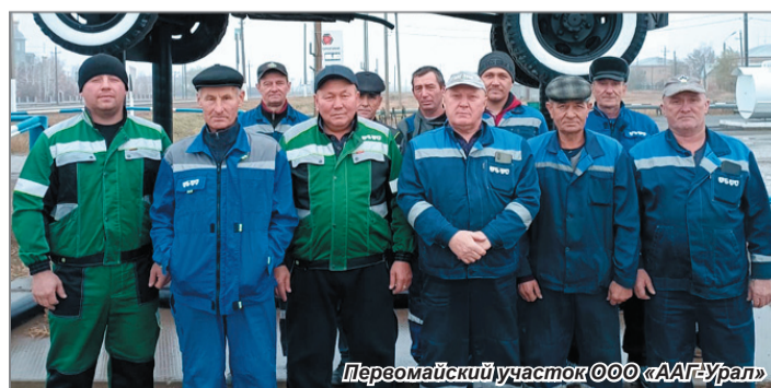
Первомайский участок ООО «ААГ-Урал»

Надо сказать, что поздравляя коллективы с наступающим