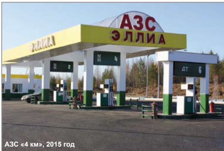
АЗС «4 км», 2015 год

Уверен, что профессионализм сотрудников и большой опыт работы на рынке нефтепродуктов и сжиженного углеводородного газа позволят и в дальнейшем коллективу адаптироваться к различным экономическим переменам, ставить новые цели и успешно их достигать».