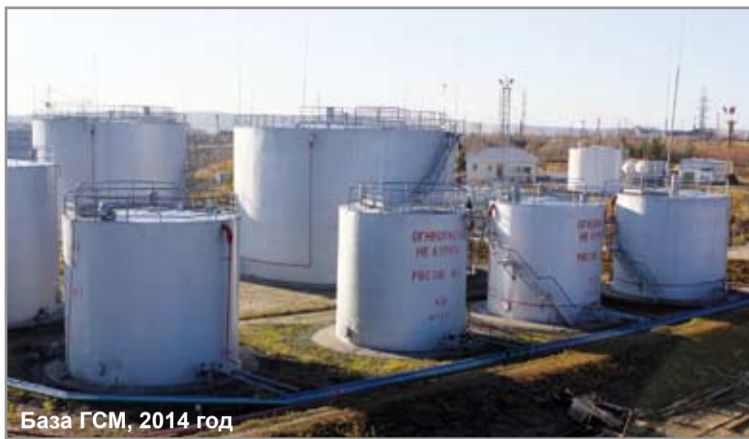
База ГСМ, 2014 год

Имея хорошую основу в секторе сбыта, компания продолжи-