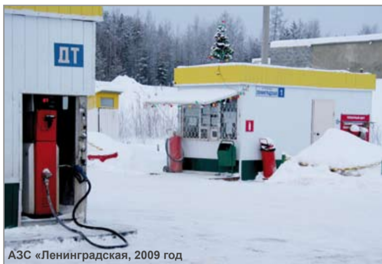
АЗС «Ленинградская, 2009 год