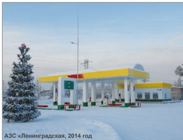
АЗС «Ленинградская, 2014 год