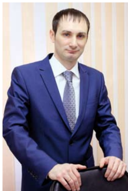
2015 ГОД: 66 ТРАНСПОРТНЫХ ЕДИНИЦ