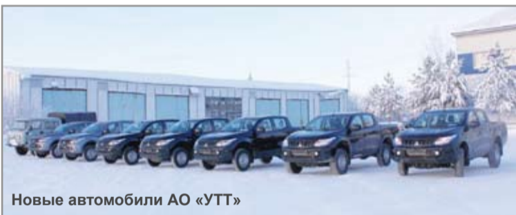
Новые автомобили АО «УТТ»

Доказанные запасы С1+С2 Мессояхской группы составляют около 480 млн тонн нефти и газового конденсата, а также более 180 млрд кубометров природного и попутного газа. Начало полномасштабной промышленной разработки – 2016 год.